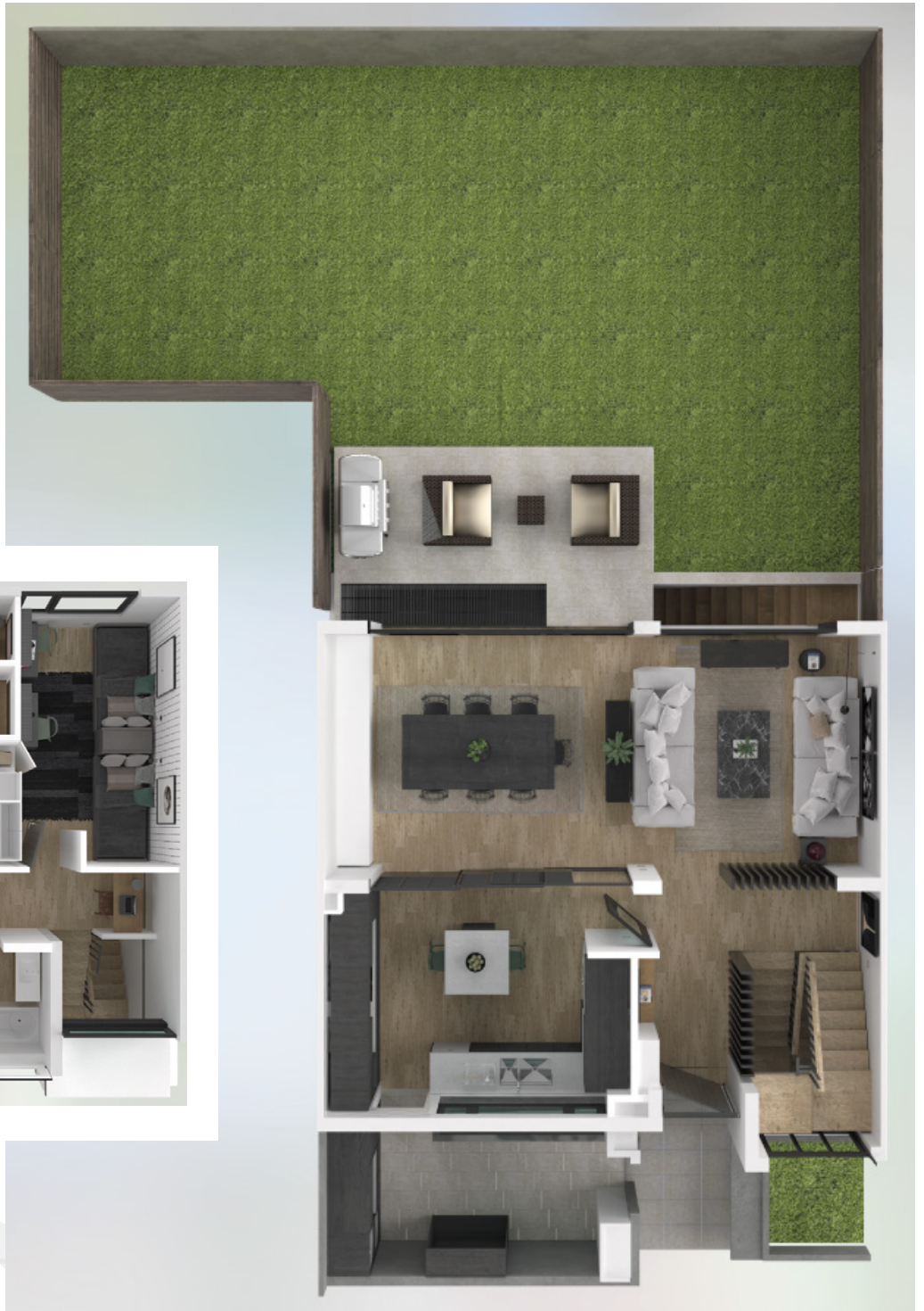
PLANTA SEGUNDO PISO